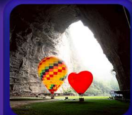
“ ถ้าถึงหลง ”