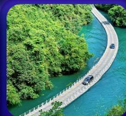
“ หุบเขาสิงโต ซื่อจื่อกวน ”